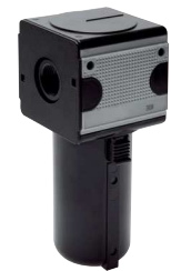
Typ FA 12 MBK